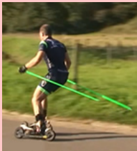
Lekker geskiket t of geskiked d ?

LET OP: Een VD kan nooit op -dt eindigen ( gebrandt ). De regel STAM + t geldt alleen voor de PV tegenwoordige tijd. [VD gebruikt als Bn: zie hieronder.]