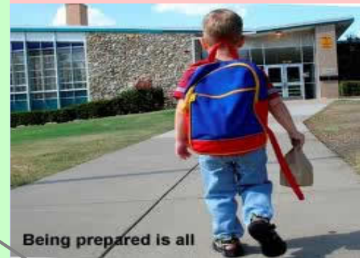
Being prepared is all

Let op: In het voorbeeld hier en in de volgende zijn woorden of woordgroepen gemarkeerd . Dit zijn signaalwoorden . We komen hier later op terug. Het zal je inmiddels tevens duidelijk zijn dat je een bouwplan het handigst uitwerkt in telegramstijl. Je gebruikt dan automatisch kernwoorden of korte kernzinnen , omdat een bouwplan zich moet beperken tot de hoofdzaken in een tekst. Dit wordt je verder in deze Routeplanner duidelijk gemaakt. Raadpleeg anders ook je docent.