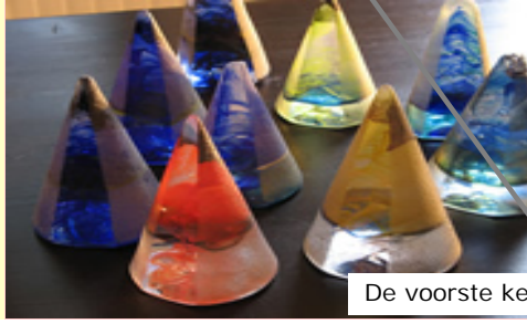
De voorste kegel

onb.vn Onbepaald voornaamwoord Woorden zonder bepaalde betekenis: men, iemand, niemand, elk, iedereen, iets, niets, wat (=iets), alles, ene, een zekere, het ( het regent ) MAAR: * Zie je dat boek? Het is mooi. > het = pvn Het kost veel moeite > veel = onb.vn MAAR: * Veel boeken > veel = o.hwtw