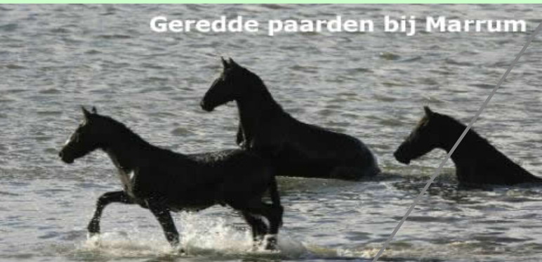
Geredde paarden bij Marrum

De regels voor verdubbeling en verenkeling bij een bijvoeglijk gebruikt voltooid deelwoord zijn dezelfde als bij gewone bijvoeglijke naamwoorden. een wit vlak – het witte vlak – de muur is gewit – de gewitte muur een breed doek – de brede weg – de weg is verbreed – de verbrede weg