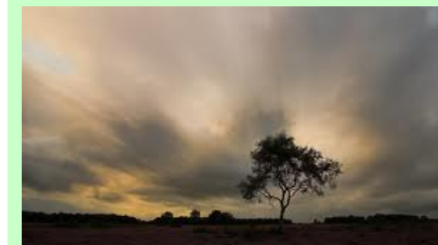
Overdreven wolken of overdrijvende wolken?

Werkwoorden met een beklemtoond voorvoegsel daarentegen (en dus een minder beklemtoonde stam) worden gescheiden vervoegd. overdrijven >> drijft over ; doorlopen >> loopt door ; omvergoaien >> gooit omver ; houthakken >> hakt hout